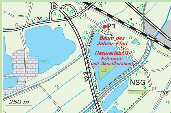
P1 Naturerlebnis Erlensee