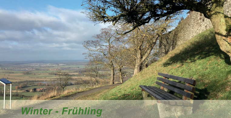
Winter - Frühling