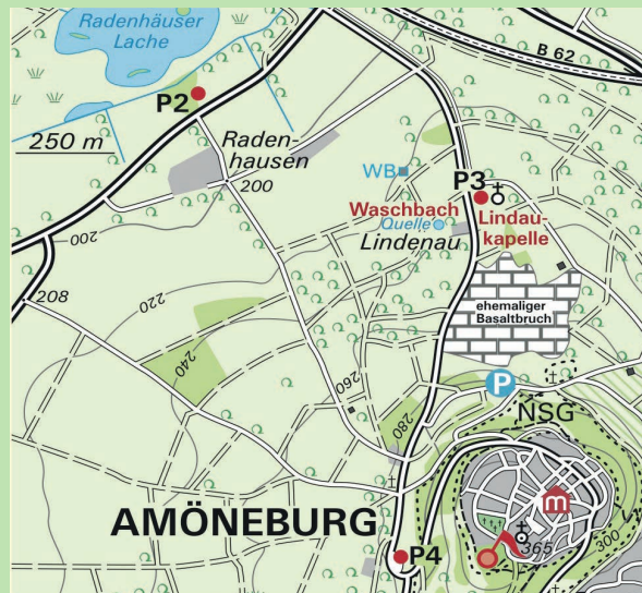
P2 Radenhäuser Lache (gegenüber Hofgut Radenhäuser an der L3088)